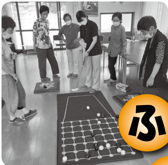
レクリエーショングッズ貸し出し (明見サロン)