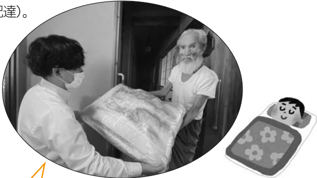
クリーニング業者から介護者へクリーニングした布団を配達

今年度も6月1日に、寝たきり高齢者を介護されている世帯（34世帯）を対象にお見舞い金を郵送させていただきました。また同対象のみなさまから希望をとり、布団のクリーニングを行いました（6/12日に回収、26日に配達）。