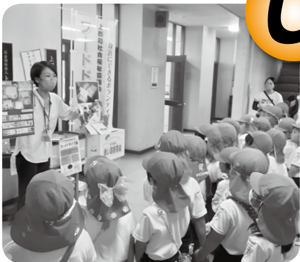
古切手の収集活動 (上郡こども園園児社協に来館)