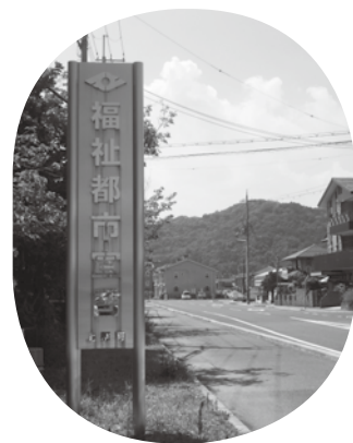
福祉都市宣言から57年。 上郡駅前にある立て看板