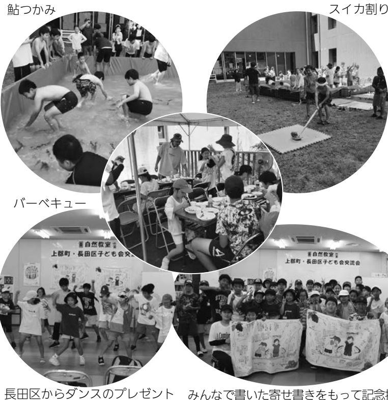
長田区からダンスのプレゼント みんなで書いた寄せ書きをもって記念撮影

長田区とは戦時中の学童疎開から交流が始まり、第1回の交流会は昭和41年9月で、同62年に上郡町自然教室という名称に変わり、現在に至っています。