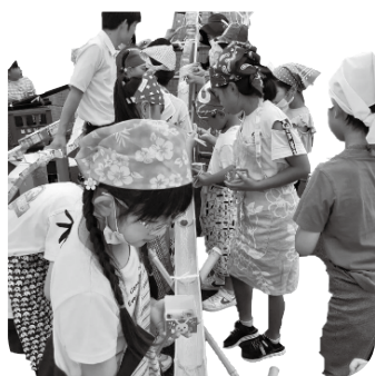
流しそうめんの様子（1日目）