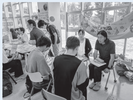
▲令和7年6月25日 関西福祉大学での学内職業研究会のようす