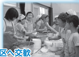
昭和40年8月神戸市長田区へ交歓 (山野里子連協から始まった)