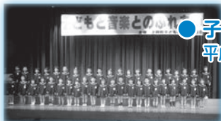
● 子どもと音楽とのふれあい 平成21年11月9日