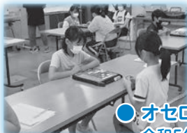
● オセロ大会 令和5年8月6日