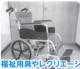
福祉用具やレクリエーショングッズの貸出