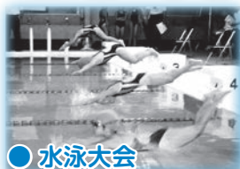
● 水泳大会 平成14年9月1日