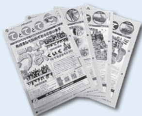
社協広報「てとてとて」