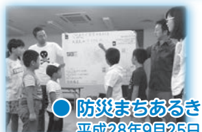
● 防災まちあるき 平成28年9月25日