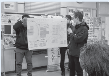
▲管理職チームの発表