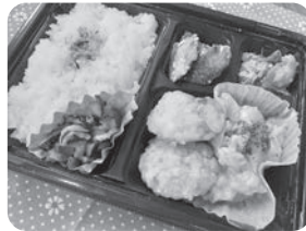
高齢者世帯の希望者への給食サービス事業