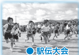
● 駅伝大会 平成18年2月5日