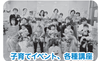
子育てイベント、各種講座