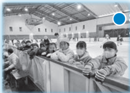
● 社会見学 令和7年1月26日